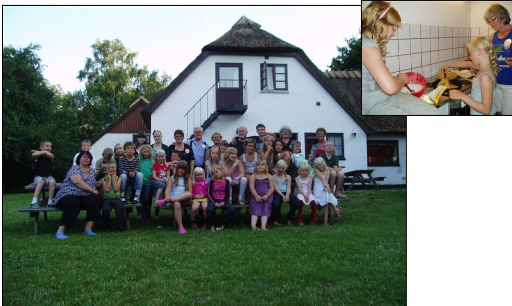
Alle fra sommerlejren 2009 og vi laver pandekager.